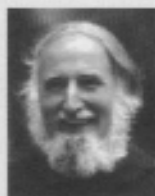
Pater Anselm Grün OSB

Zur zwölften Renovabis Pfingstaktion zum Thema Migration mit dem Jahresleitwort „Heimatlos! Mitten in Europa“ betont Pater Anselm Grün, Benediktinermonch in Münster-Schwartzach, die spirituelle Dimension des Themas. Er ruft uns die jüdischen Menschen in unserer Nachbarschaft, in den Nachbarländern des östlichen Europas in Erinnerung, die Heimat entbehren müssen. Pater Anselm erinnert uns daran, welche Tiefen der Heimatbegriff für unser geistig-geistliches Leben besitzt. Unausweichlich kommt er zu dem Ergebnis: „Wir brauchen Orte, an denen wir uns daheim fühlen. Aber wir können die Heimat nicht festhalten. Gottes Geist zeigt uns, dass wir letztlich nur in Gott Heimat finden.“